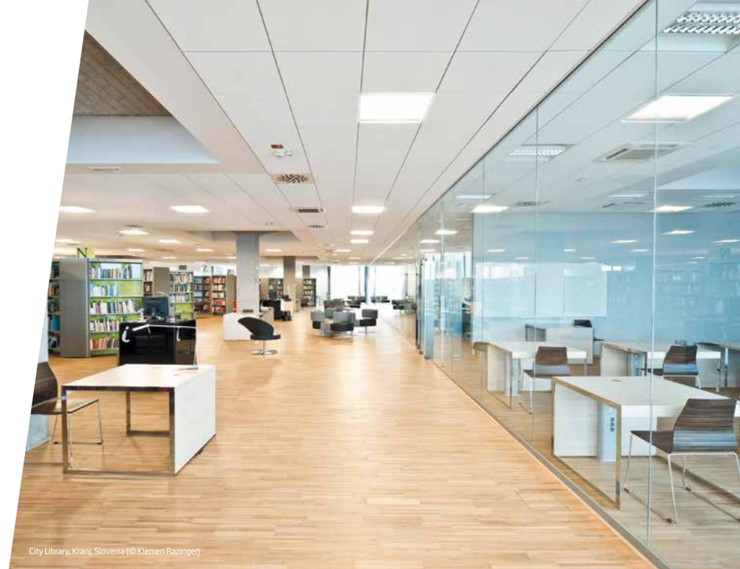
City Library, Kranj, Slovenia