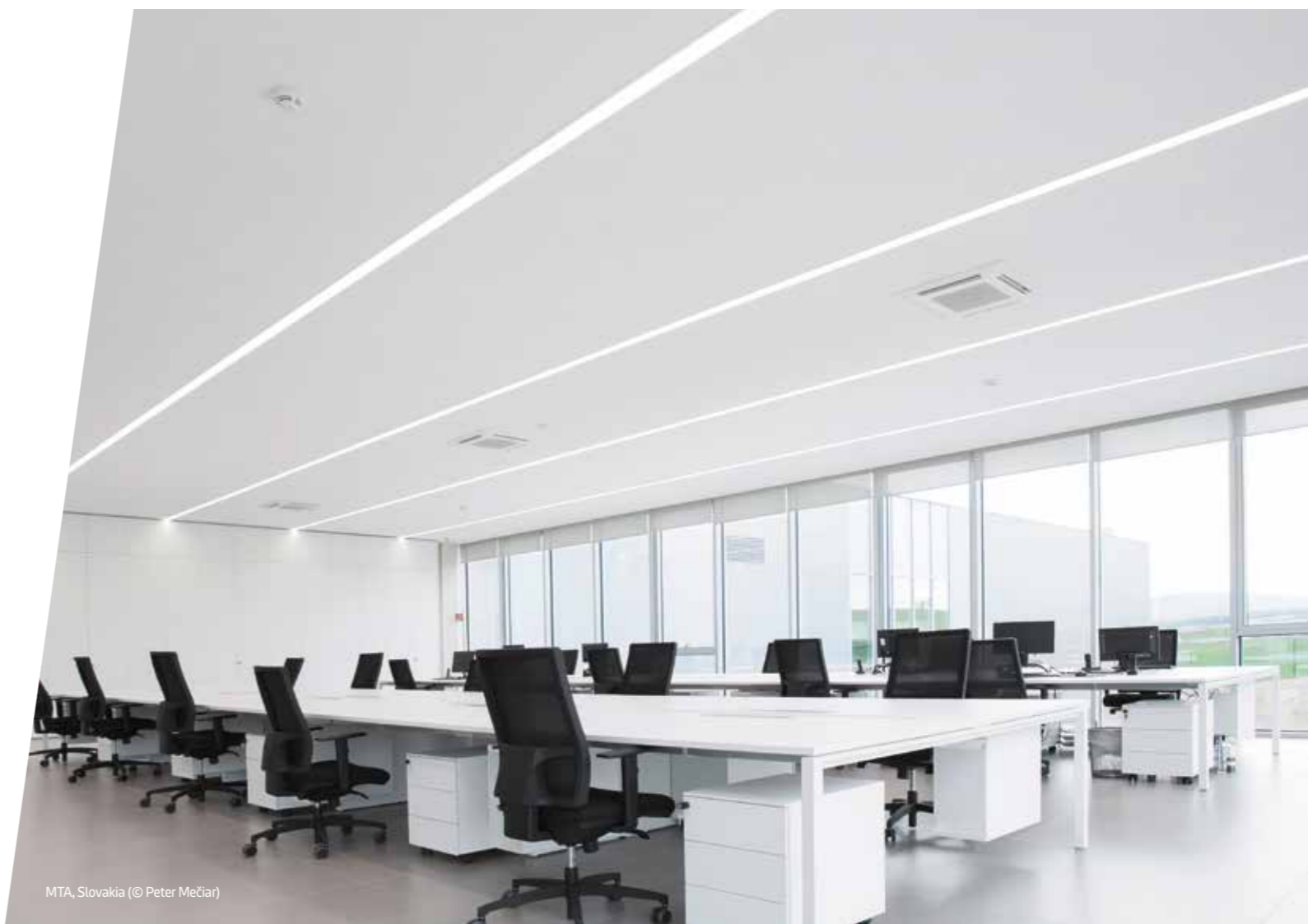
MTA, Slovakia