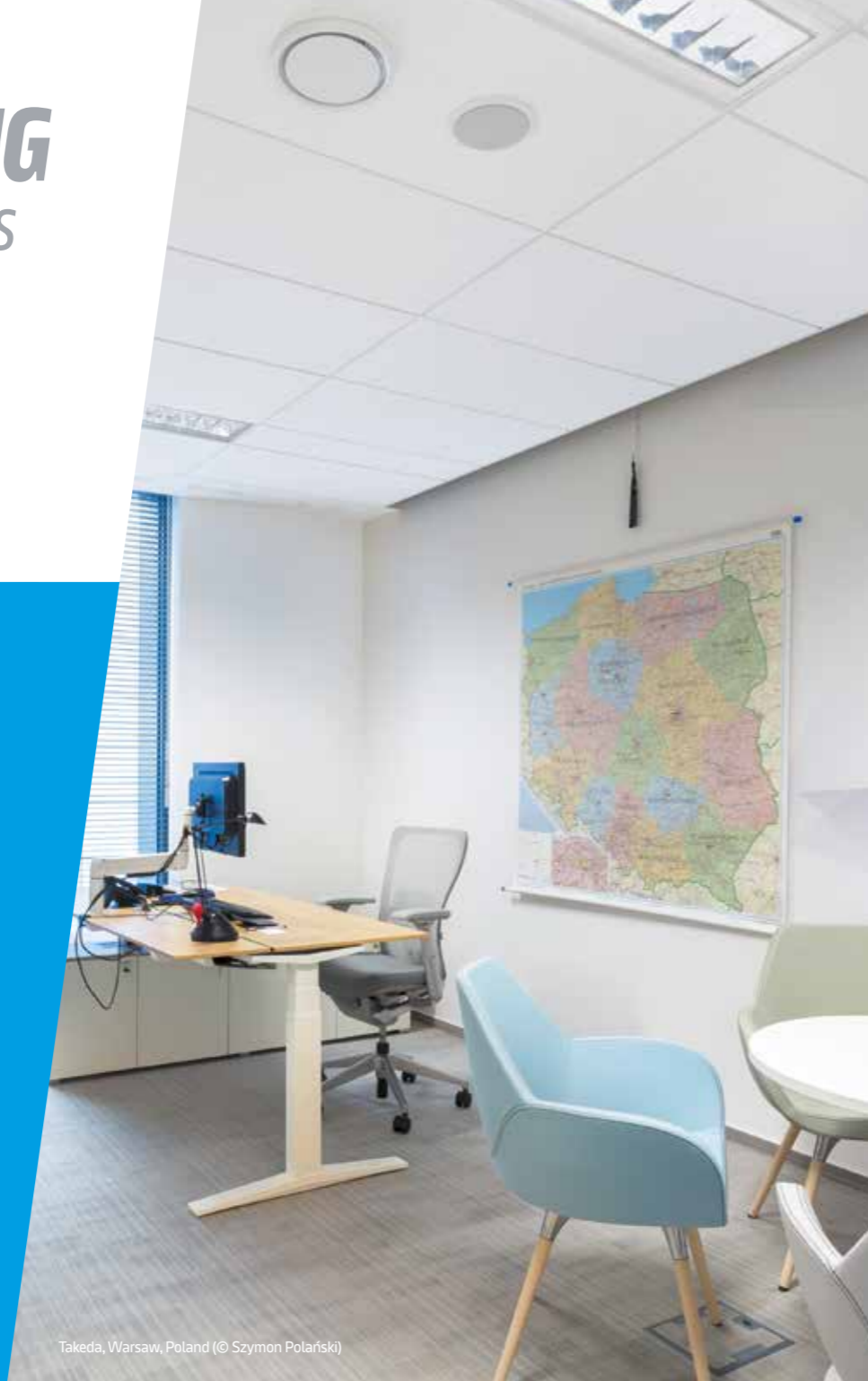
Takeda, Warsaw, Poland