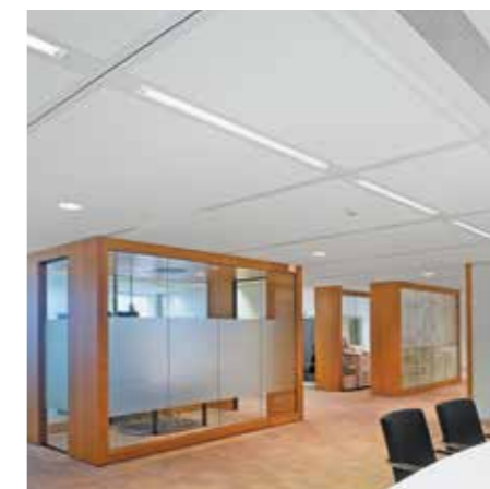
Van Oord Headquarters, Rotterdam, Netherlands

Von sichtbar bis vollständig verdeckt, ADAGIO kann jede Designvision erfüllen.